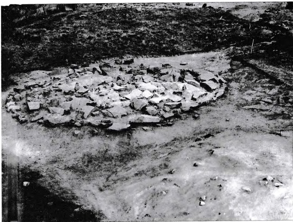
4. Ett flertal gravar var upbyggda av skärvig sten. Grav 50 innehöll två gravlagda individer.

tydliga paralleller mellan Sund och Vallhagar. Den stora skillnaden är att de gotländska husen framför allt kan dateras till yngre romersk järnålder och folkvandringstid. Men oavsett vilka paralleller som återopås står det dock klart att det terrasserade huset vid Sund redan i det initiala skedet tolkats som sätet för en aristokrati och inte traktens gemene bondebefolkning.