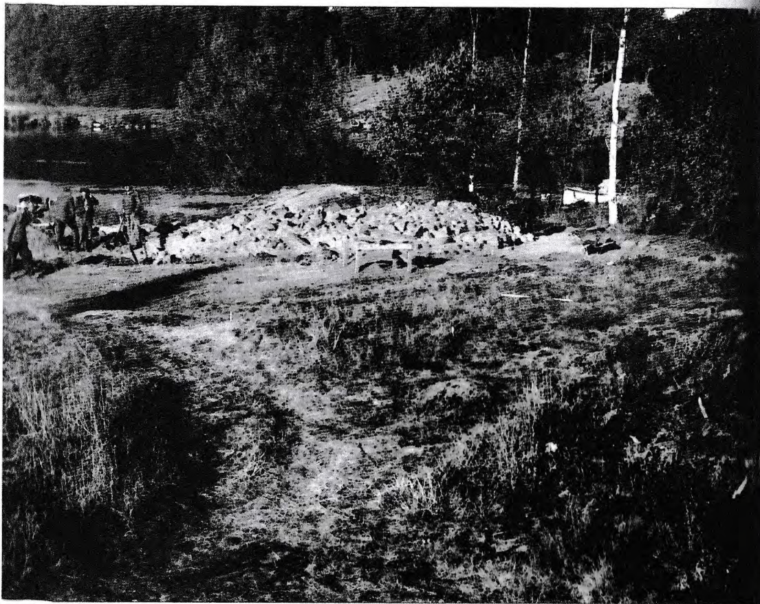
1. Hög 54 har legat alldeles vid kanten av älven där den varit i blickfång för alla som passerade förbi.

platsens forna karaktär. Det vi fann var några fragmentariska rester av gravfältet men det gick inte att ta miste på vilket exceptionellt läge gravfältet haft i forna dagar, alldeles vid Byälvens östra kant och precis nedströms en mindre fors (Fig. 1). Ännu tydligare blir dess strategiska läge om den appliceras på SGU's höjdnivåkarta som visar att gravfältet hade anlagts på strandkanten i det innersta partiet av en mindre vik. Trakten är känd för ett stort antal gravar men också fornborgar och storchögar där lokaliseringen till Byälven har att göra med förbindelseleder västerut (Axelsson 2000:123).